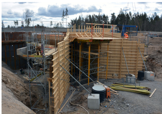
Arbete med bro över en enskild väg söder om Kånna.