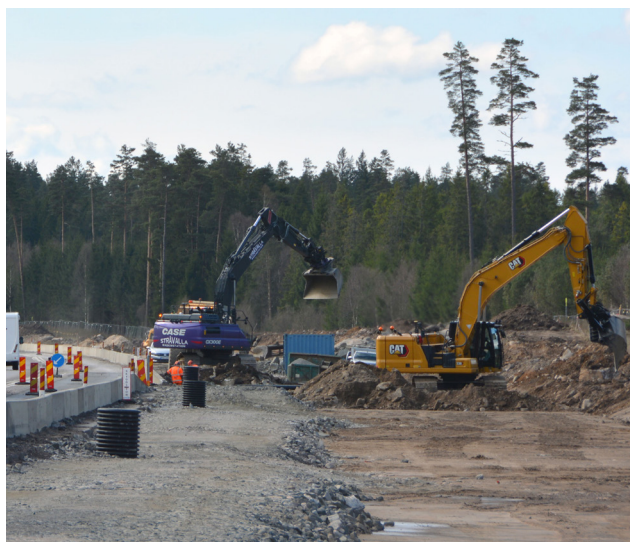
Breddning av södergående körbana i höjd med Berghem.