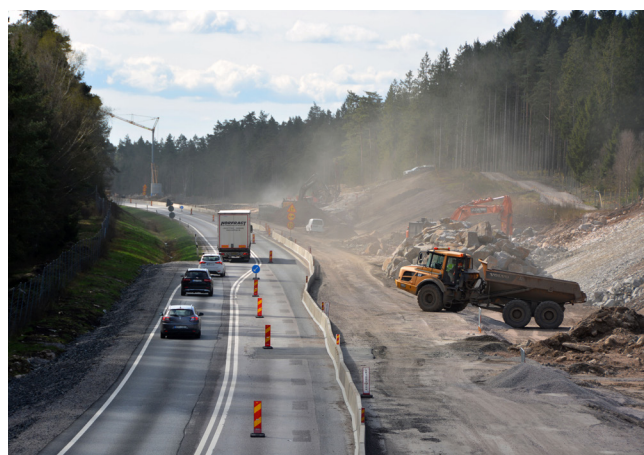
Vy söderut från bron i höjd med Kånna. Här pågår arbete med att schakta bort sprängt berg, terrassering och fyllnadsarbete.