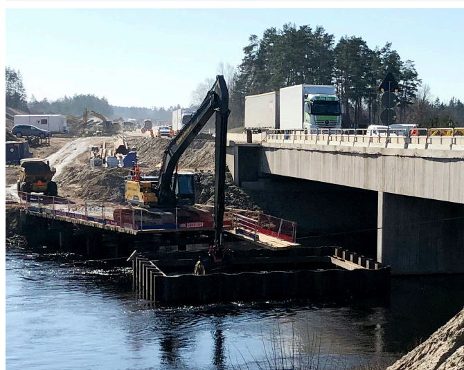
Här pågår arbete med mittstödet för ny bro över ån Lagan.