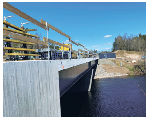
Ny bro över Lagan Å.

Du är alltid välkommen att kontakta oss om du har frågor.