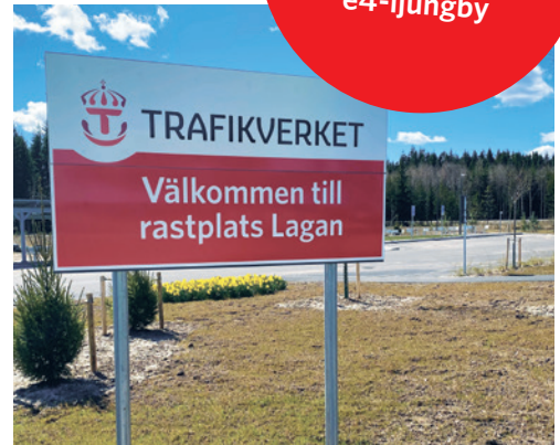
Rastplats Lagan öppnades i december 2020.

Vill du veta mer? Läs gärna mer om projektet på www.trafikverket.se/e4-ljungby