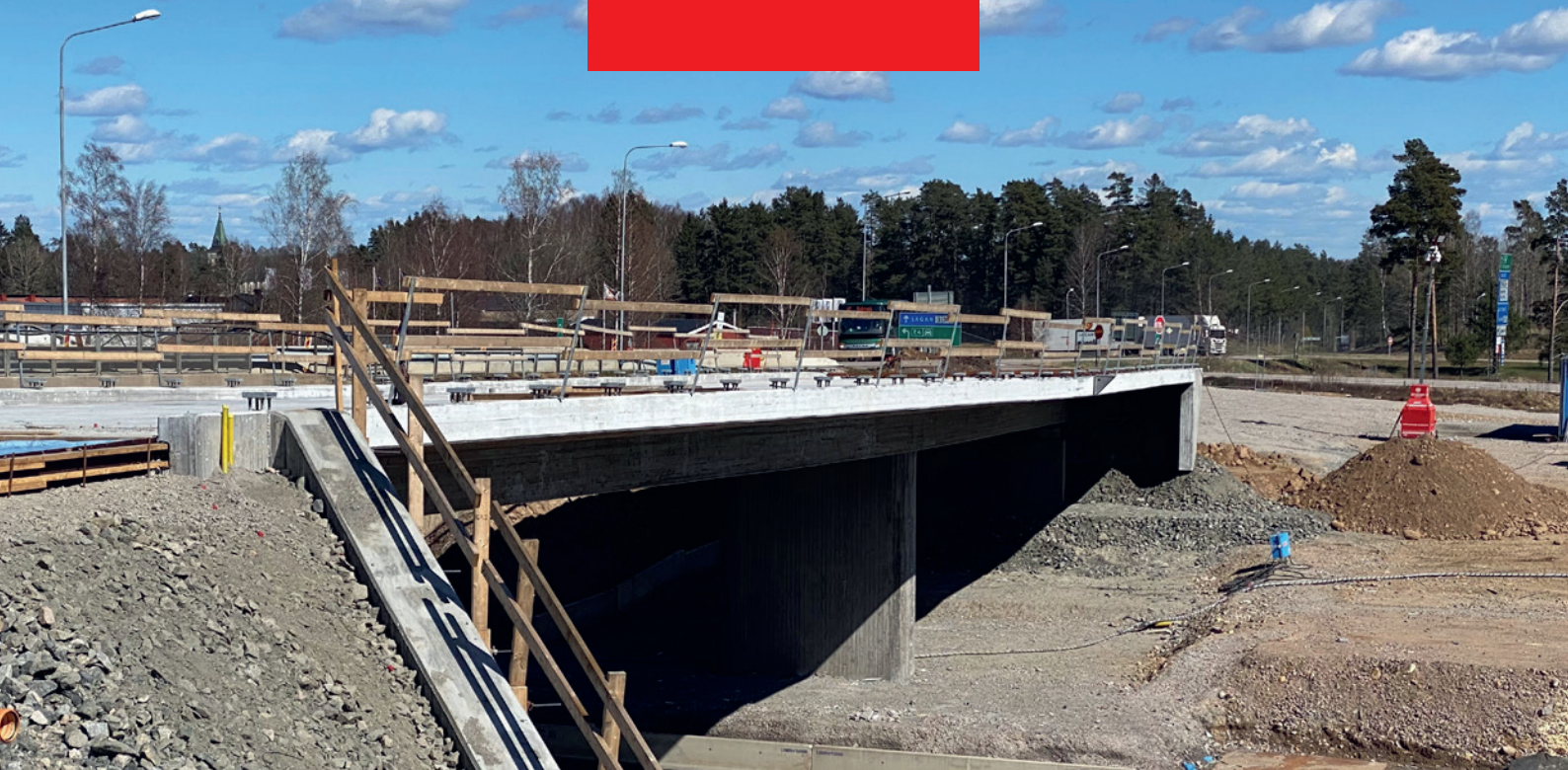
Ny bro i Trafikplats Lagan.