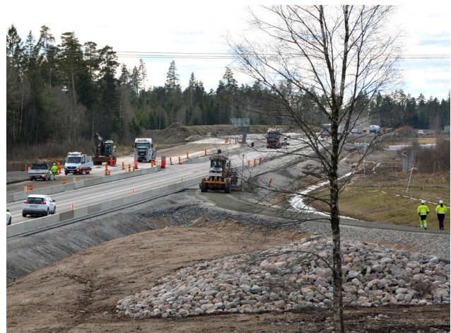
Trafikplats Ljungby norra är klar hösten 2023.