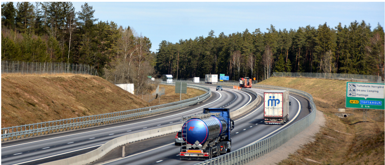
Ny motorväg med fyra körfält genom Bergaåsen.

Trafikverket, Box 810, 781 28 Borlänge. Besöksadress: Röda vägen 1 Telefon: 0771-921 921, Texttelefon: 010-123 50 00 trafikverket.se