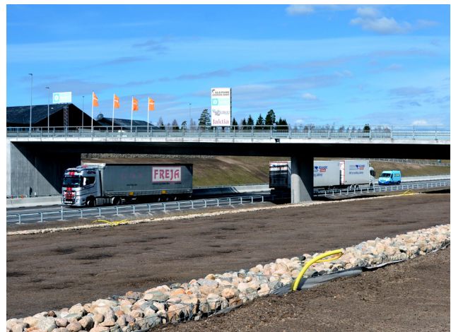
Trafikplats Lagan är klar sommaren 2023.