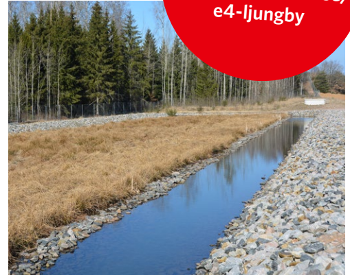
Översilningsyta för rening av vägdagvattnet innan det släpps ut i vattendrag.

Vill du veta mer? Läs gärna mer om projektet på www.trafikverket.se/ e4-ljungby