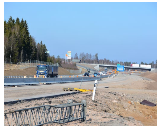
En del av sträckan med 1+1 körfält utan mötesseparering och nedsatt hastighet till 70 km/tim.

Du är alltid välkommen att kontakta oss om du har frågor.