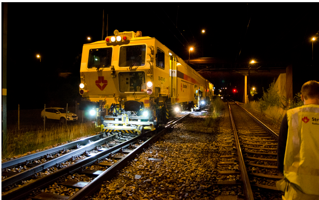
En spårriktarmaskin lyfter upp rälsen samtidigt som den fyller på och packar ballasten hårt.