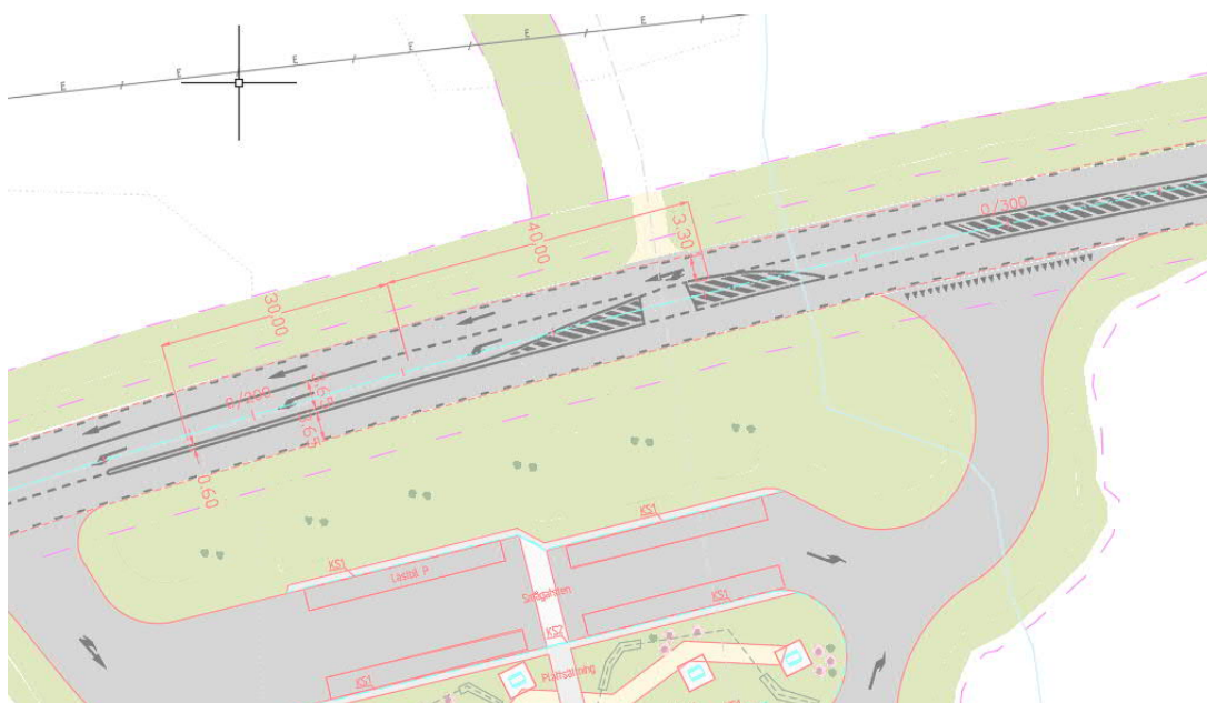
Figur 2. Illustrationsplan efter ändring