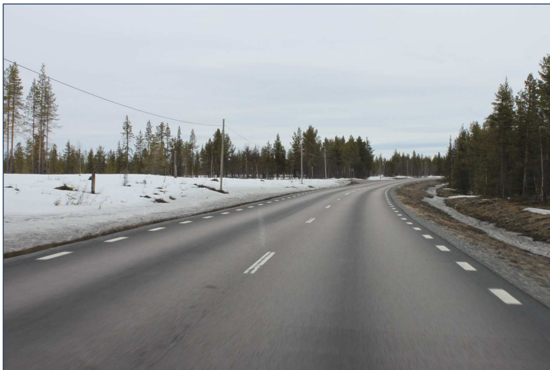
Figur 1-1. E10 är smal med dålig sikt. Vy mot norr.

E10 mellan Gällivare och Kiruna är en viktig näringslivsväg och andelen tung trafik är stor. Vägen sträcker sig från Luleå i söder till Å, Norge, i norr. Trafiken har ökat i området under de senaste åren och det är svårt att göra säkra omkörningar och utfarter från korsningar. I kombination med en smal väg och dålig sikt skapar detta problem för både trafiksäkerhet och framkomlighet för de trafikanter som färdas längs vägen. Vintertid ökar dessa problem när snö, halka och mörker ytterligare hindrar trafikanterna. Därav har många önskemål om att sträckan skall byggas om kommit in till trafikverket.