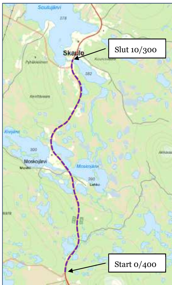
Figur 1-3. Detaljerad översikt av aktuell vägsträcka från infarten till Avvakko till Skaulo.