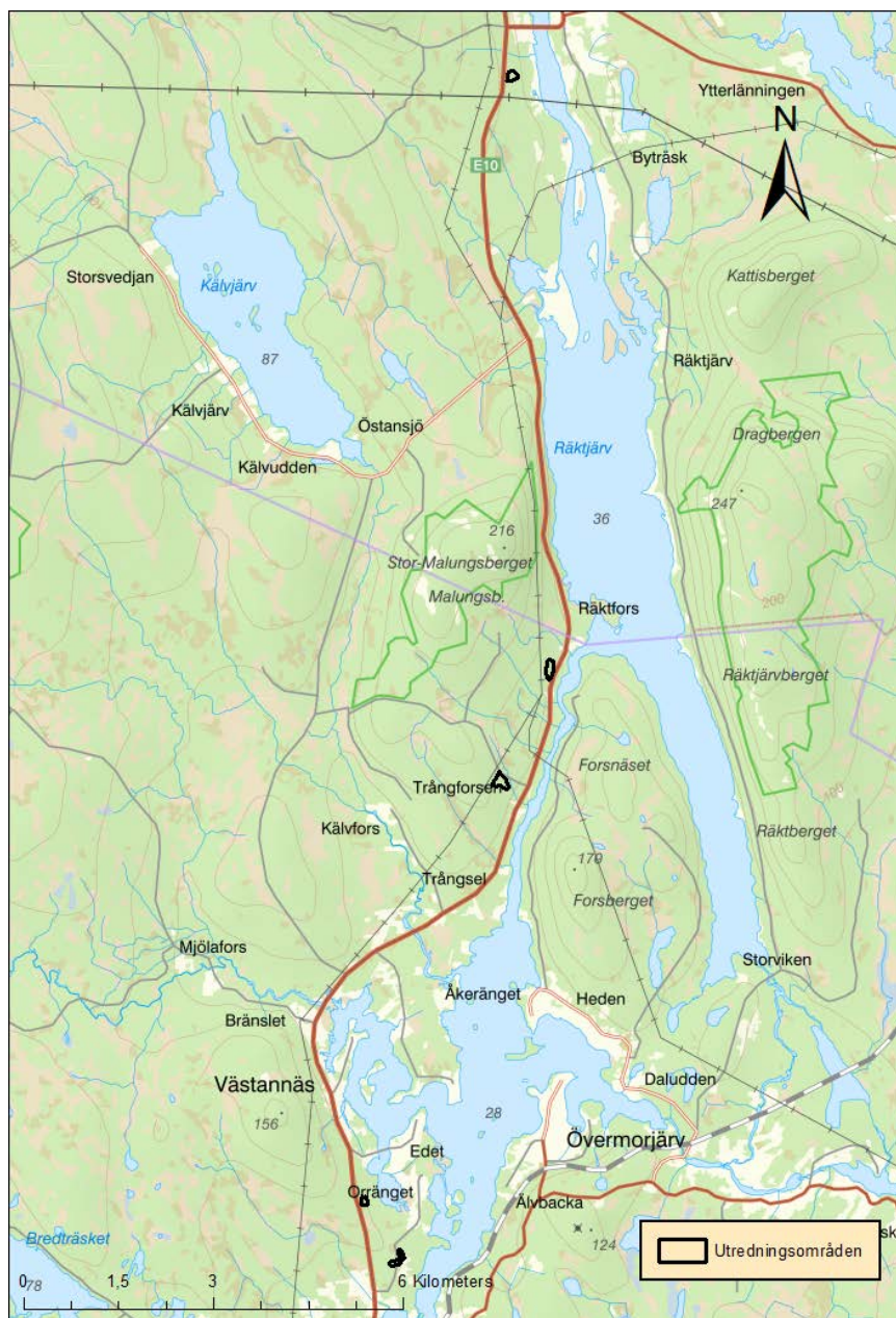
Figur 1. Översiktskarta med samtliga sex utredda ytor markerade med svart begränsningslinje.