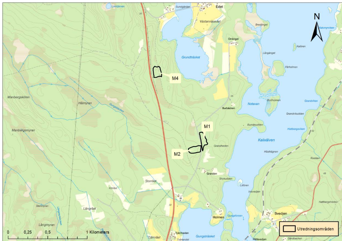
Figur 2. Detaljkarta över utredningsområden M1, M2 och M4.

Område/Yta M2 – ligger i anslutning till mindre grusväg, området består av sand- och grusmark och är avverkat och markberett. Då området är belamrat med markberedningsgropar besiktades dessa okulärt och det var inte motiverat att ta upp ytterligare gropar. Inga lämningar påträffades.