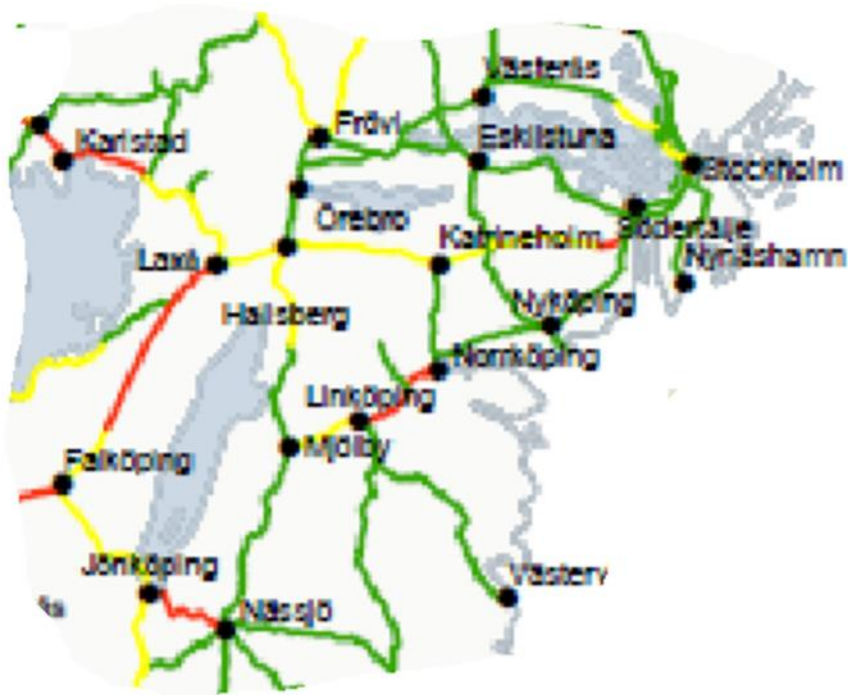
Bild 1: Kapacitetsutnyttjande dygn 2019. Rött = högt kapacitetsutnyttjande, Gul = medelhögt kapacitetsutnyttjande, Grön = lågt kapacitetsutnyttjande