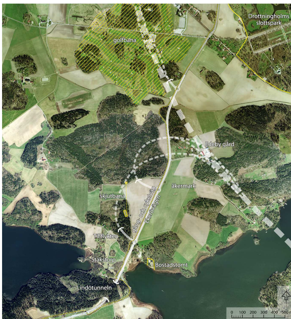
Figur 2. Sentida förändringar i landskapet kring Edeby.