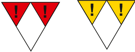
Figur 3. Skyddas för växlingsstöt

Fordon med märkningen Skyddas för växlingsstöt (se figur 3) eller med varningsetikett för farligt gods ska handbromsas eller stoppas med två bromsskor.