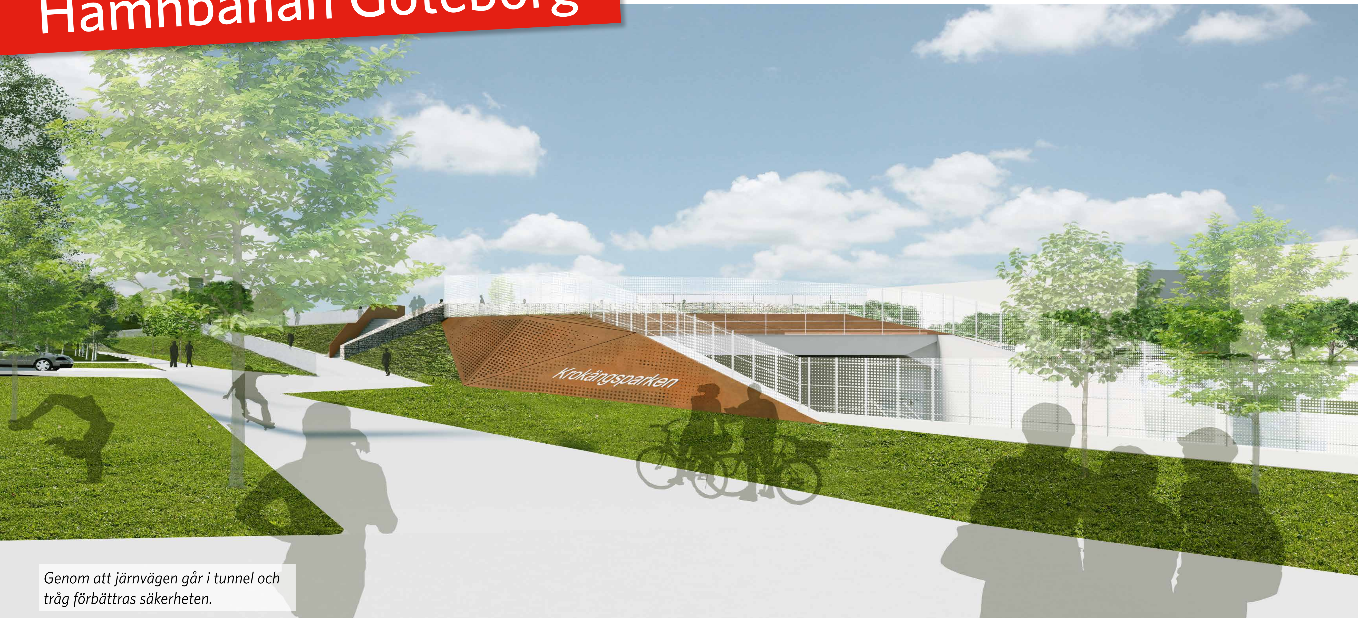
Genom att järnvägen går i tunnel och tråg förbättras säkerheten.