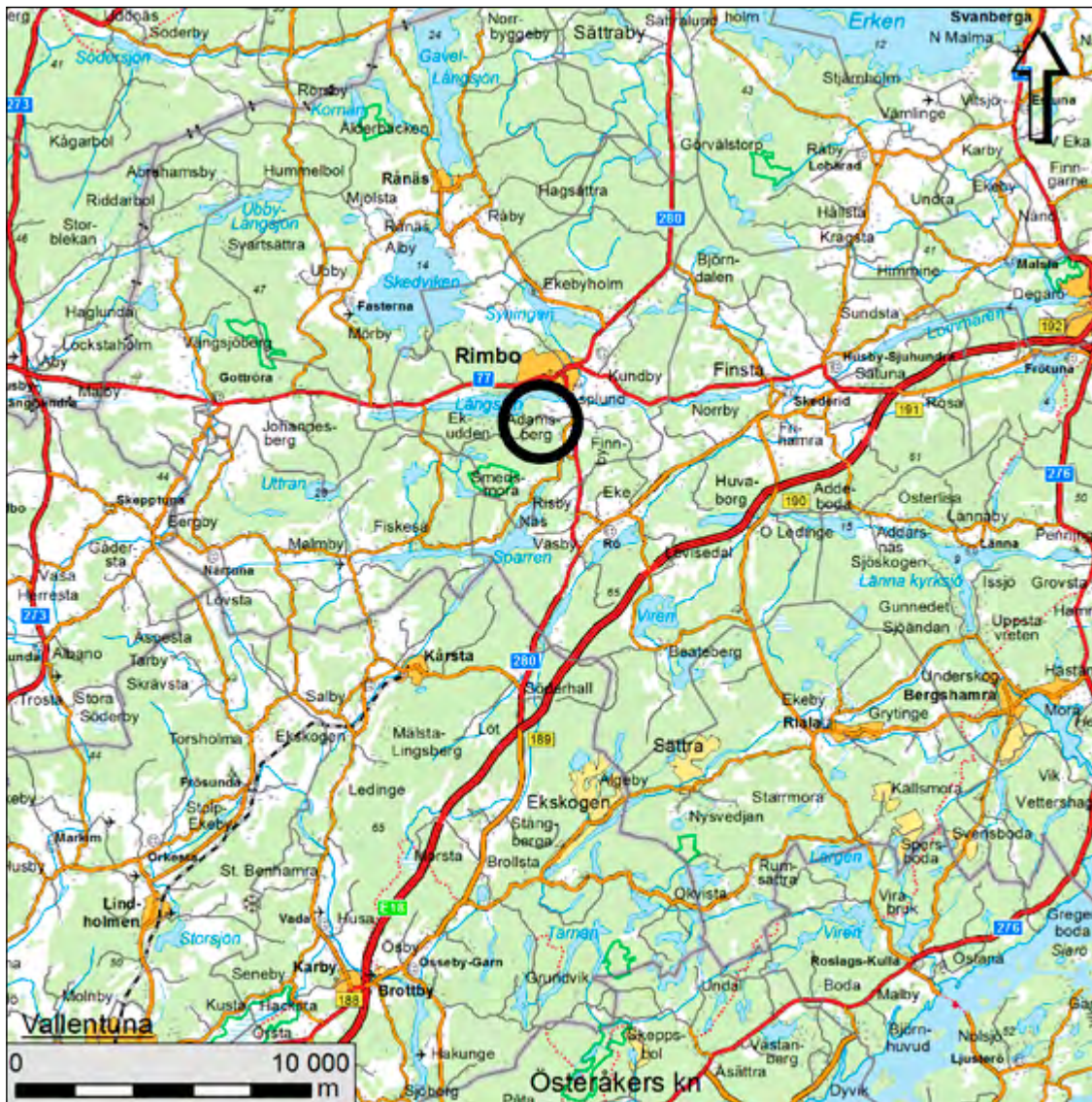
Figur 1. Utredningsområdet markerat med svart. Skala 1:250 000.