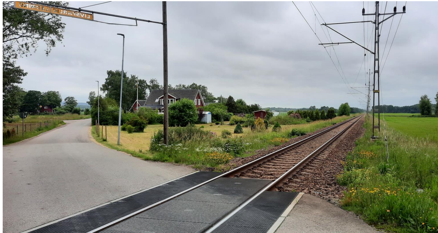
Korsningen på bilden påverkas inte