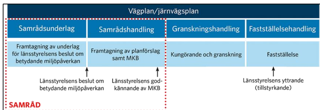
Figur 2 Trafikverkets planläggningsprocess för vägplan.

Trafikverkets planläggningsprocess för vägplan illustreras i Figur 2.