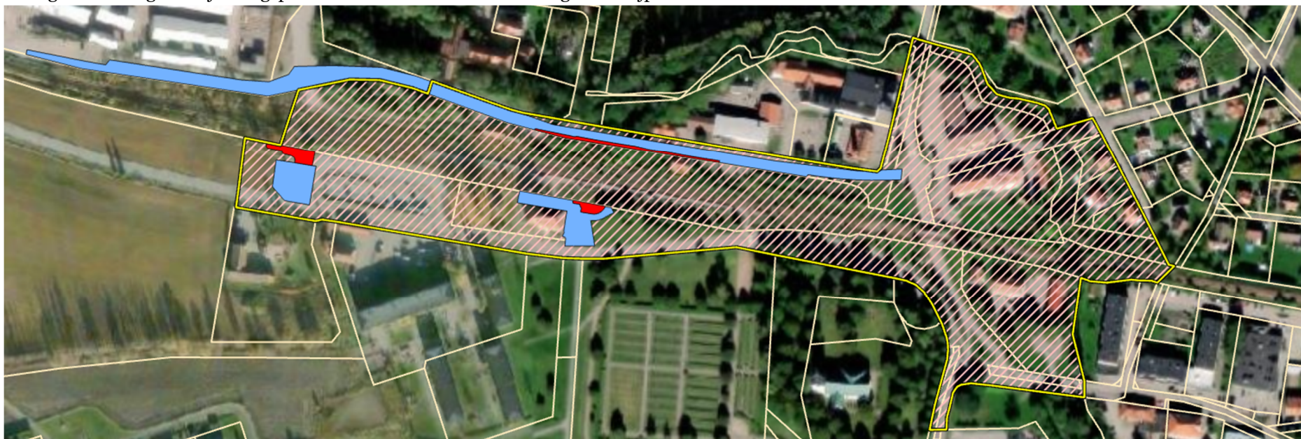
Figur 1. 1917-P26 Detaljplan för Heby järnvägsbro Storgatan och stationsområdet, DP 273. Intrång från markanspråk är redovisat i bilden. Blått = tillfällig nyttjanderätt, Rött = äganderätt.

Slutlig bedömning är att järnvägsplanen kommer att innebära omtag av detaljplanen.