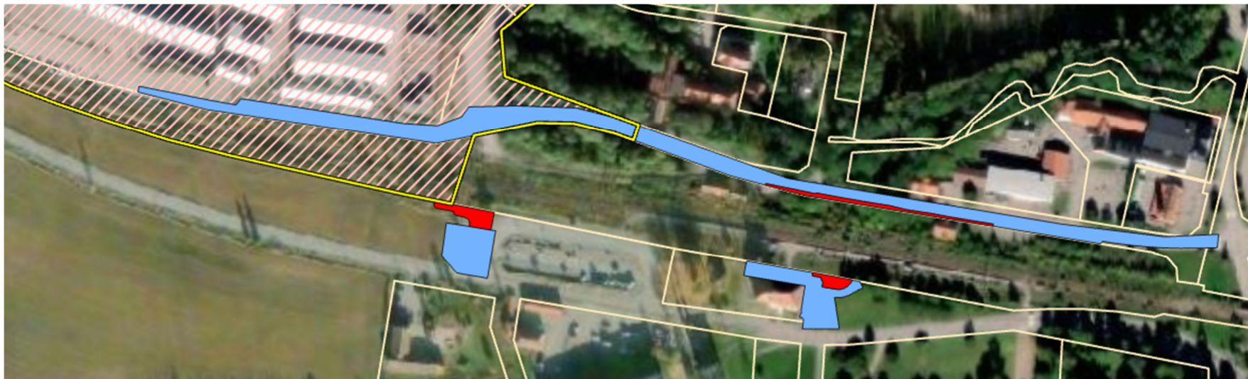
Figur 2. 1917-P36 Detaljplan för del av Heby, industriområde Heby såg, DP 272. Intrång från markanspråk är redovisat i bilden. Blått= tillfällig nyttjanderätt, Rött= ägarerätt.

Delar av detaljplanen berörs av den mark som järnvägsplanen tar i anspråk för tillfällig nyttjanderätt, se Figur 2. De delar som berörs av tillfällig nyttjanderätt betecknas allmän plats – lokalgata samt som begränsning av markens bebyggande i form av prickad mark. Inom den prickade marken finns en gemensamhetsanläggning för väg och området tillhör och används av sågindustrin och som tillfart till fastigheterna i Siggbo (väster om väg 56). Slutlig bedömning är att järnvägsplanen inte kommer att innebära omtag av detaljplanen.