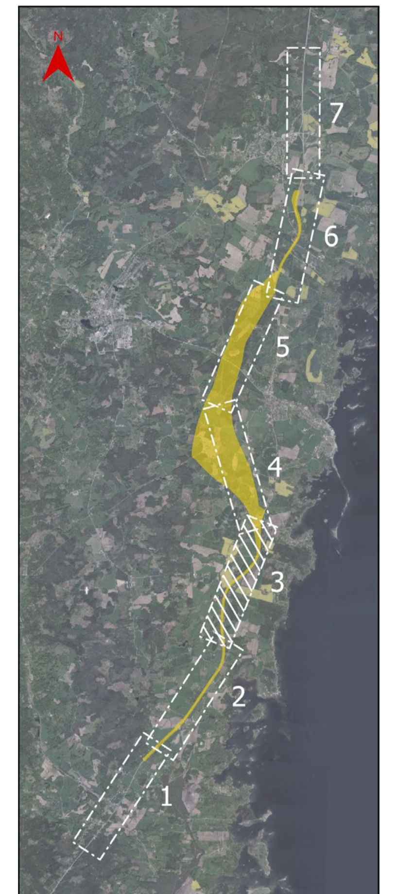
Figur 3: Orienteringskarta