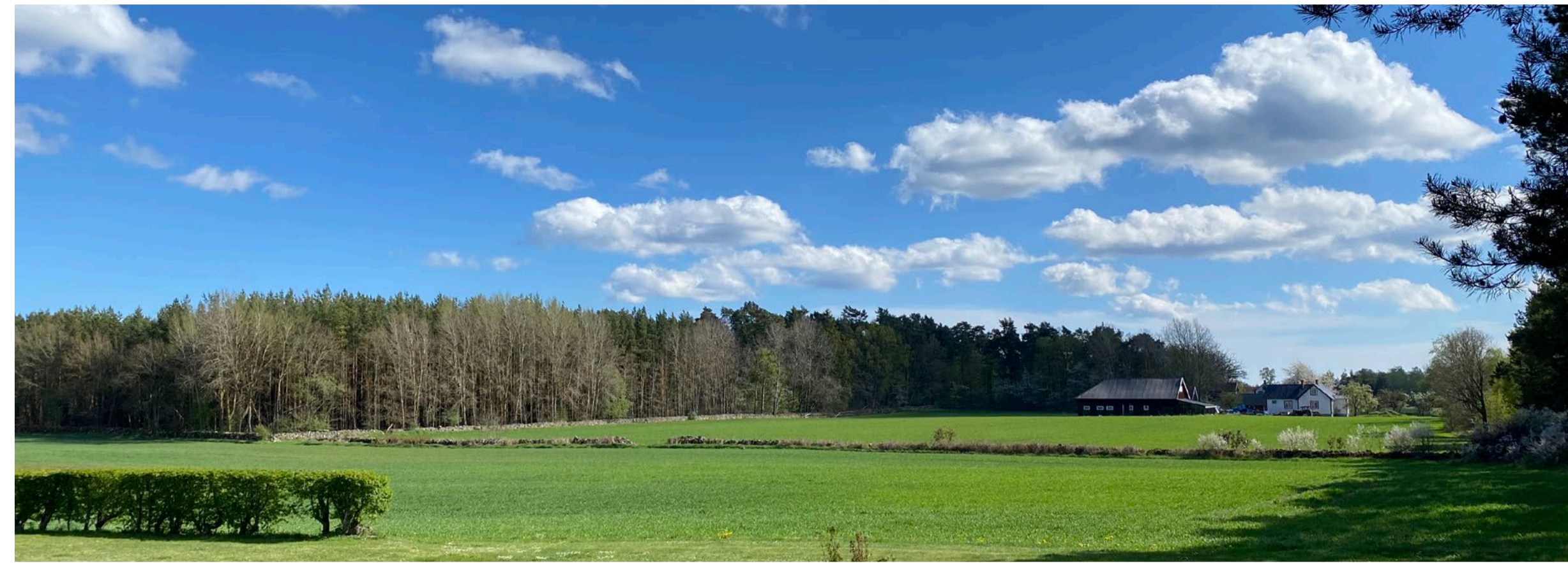
Figur 1: Vy söderut från Grönadal (där ny enskild väg föreslås)

Ombyggnaden av E22 till mötesfri väg sker norrut från väg 512 mot Bröms till Påboda. Då vägen genomgår en större förändring genom breddning, hastighetshöjning och ombyggnad till mötesfrihet tillämpas riktvärdena för väsentlig ombyggnad för nya E22. De bostäder som anses bullerberörda kommer att utredas tillsammans med olika former av bullerskyddsåtgärder. Exempel på bullerskyddsåtgärder är bullerskärmar, bullervallar, fasadåtgärder eller lokal skärm vid uteplats. Val av åtgärd avgörs från fall till fall beroende på aktuella bullernivåer samt vad som är tekniskt och ekonomiskt genomförbart.