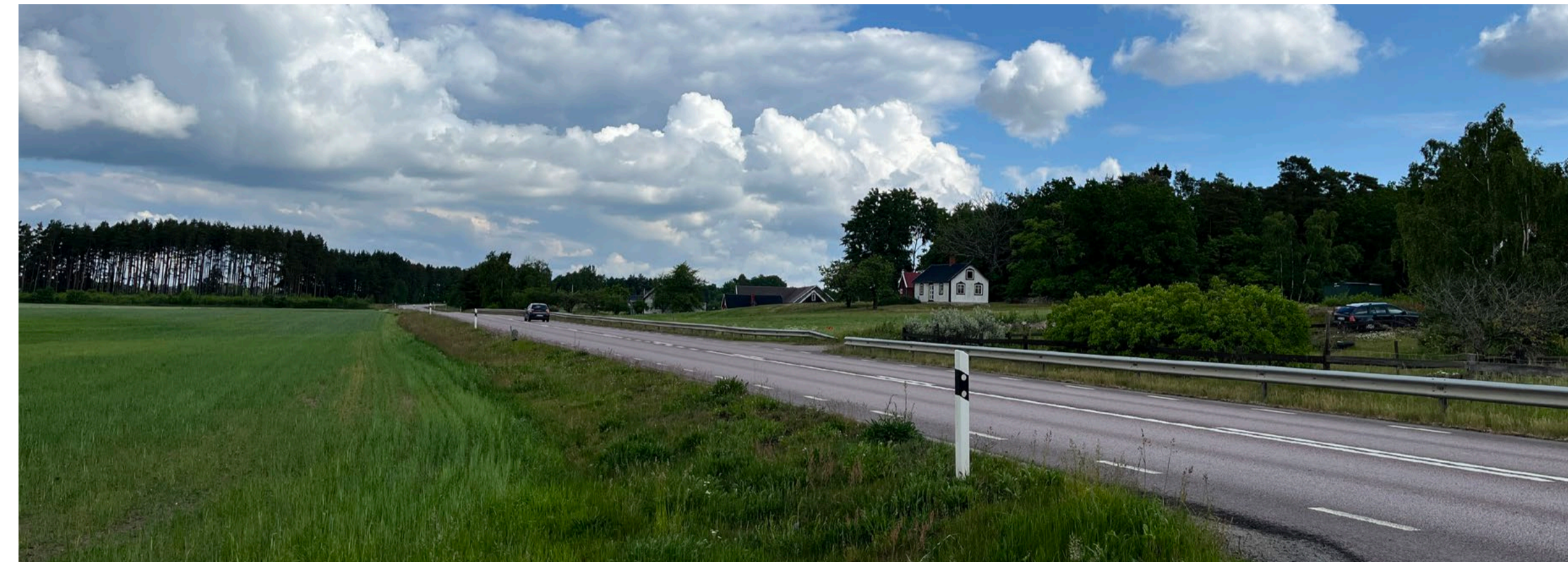
Figur 2: Vy norrut från betesmarken. Breddning föreslås på västra sidan samt en ny enskild väg mellan Kabbetorp 2:3 och Sandlycke