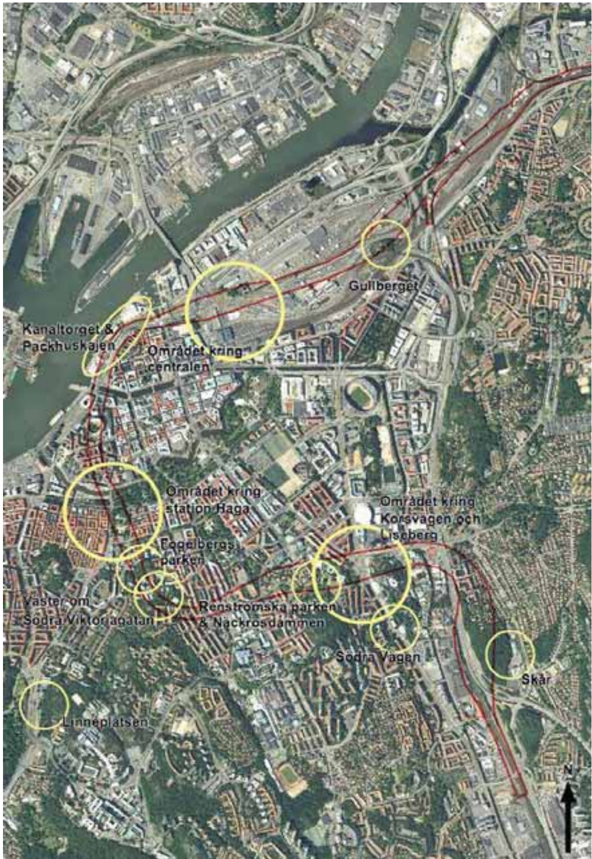
FIGUR 2.1. Karta över de parkområden som berörs av anläggandet av Olskroken planskildhet samt Västlänken och dess arbetstunnlar. Järnvägskorridoren är markerad i rött.