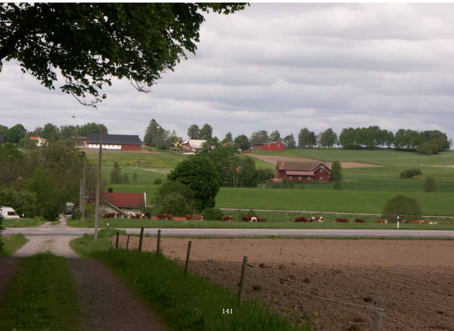
Figur 7.1:1 E20 går tvärs genom Hols inägomarker.

Ny E20 i Järnvägskorridoren kan upprätthålla Säveåns dalgång som ett historiskt kommunikationsstråk utan att det medför stora negativa konsekvenser för kulturmiljön. Vägen kan påverka upplevelsen av kringliggande kulturlandskap vid gravfälten i Hol med buller och eventuell siktskymmande vegetation. Intrånget är begränsat - inga värdekärnor i Hol berörs - men känsligheten i området är stor. I Bäne kom-