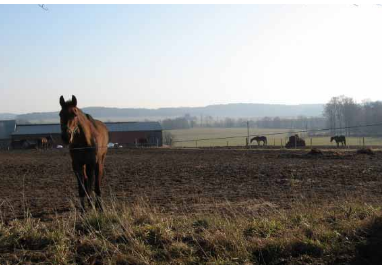
Figur 2.11:1 Hästgårdarna är många i utredningsområdet.

Gemensamt för de flesta häststall är att de för sin verksamhet är beroende av att ha tillräcklig tillgång av rasthagar, beteshagar, ridstigar, med mera. Där det förekommer travstall används ibland mindre vägar för travträningen. Ett sådant exempel är strax öster om Gongstorp.