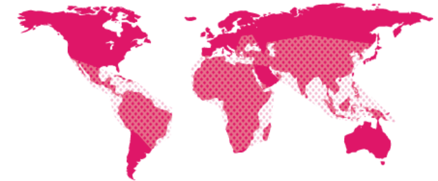
Fokus på låg- och mellaninkomst länder