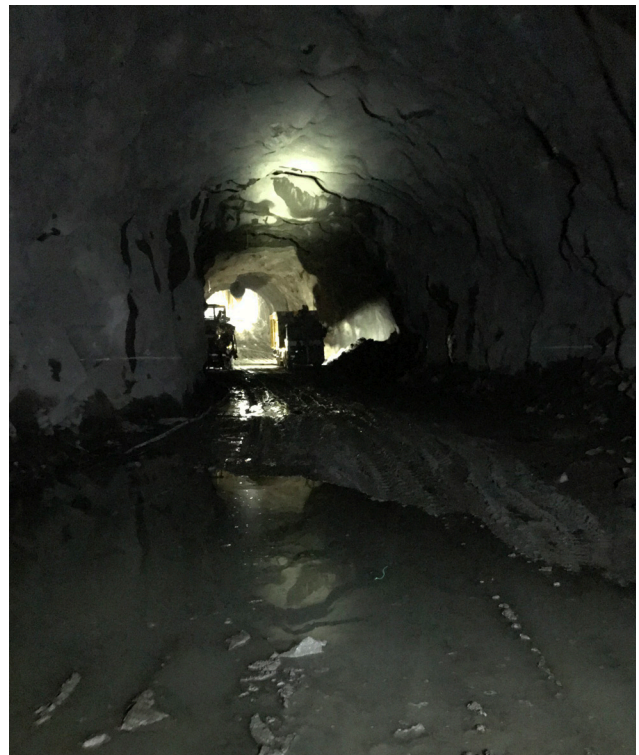
Arbetstunneln från Södra vägen är på god väg mot området i berget under Renströmsparken där vi ska spränga ut Västlänken och station Korsvägen.

Västlänken är en järnväg i tunnel under centrala Göteborg som ger staden genomgående pendel- och regiontågtrafik. Tre nya stationer vid Korsvägen, Haga och Göteborgs central gör att du kan resa enklare, snabbare och med färre byten. Västlänken öppnar för trafik 2026. Följ bygget av Västlänken på www.trafikverket.se/vastlanken VÄSTLÄNKEN ÄR DEL AV DET VÄSTSVENSKA PAKETET