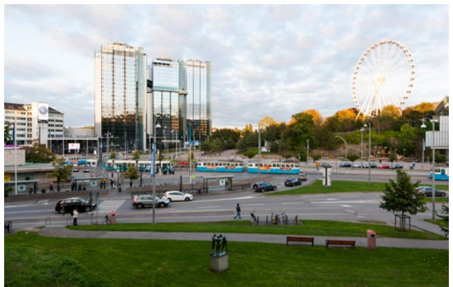
Under bygget kommer vi att följa upp vår miljöpåverkan. Vi mäter bland annat vibrationer, förändringar i grundvattnet, buller och luftkvalitet.

Villkoren i vår miljödom innebär att vi under vardagar mellan 07–19 normalt får bullra 45 decibel inomhus, vilket är ungefär som en tyst modern diskmaskin. Mellan 19–22 sjunker det till 35 decibel, vilket är samma som på helger mellan 07–19. Vi kommer inte att arbeta med bullrande arbeten under natten.