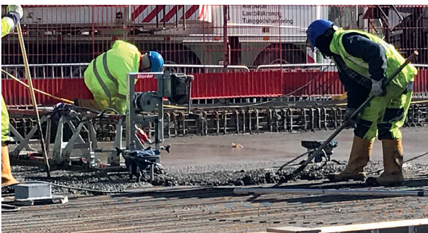
I början av april göts bron som trafiken ska flytta över till nu i sommar.

Väg- och spårömläggningar är arbeten som ger upphov till buller som kan påverka dig som bor eller verkar i området. Vi kommer både ta bort gamla anläggningar och uppföra nya. Våra beräkningar visar att vi riskerar att överstiga riktvärdena för bullrande arbetsmoment under perioden 13 juni till 19 juli och dispens för arbetet har sökts hos länsstyrelsen i Västra