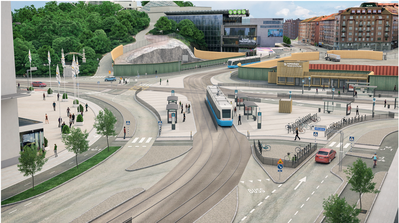
En illustration över hur Korsvägen ser ut efter sommarens trafikomläggning. Vyn är från Skänegatan söderut.