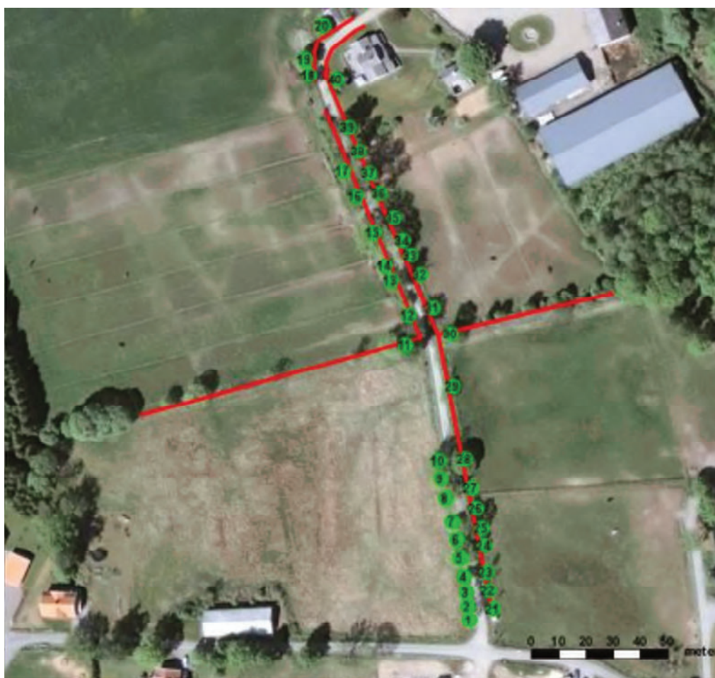
Figur 26. Inventerade träd i Simmenäs allé. Vägen längst ned i bilden är Kärbo gata. De röda linjerna påvisar stenmurar och de gröna prickarna med numrering är enskilda träd.

exponeras för starkare vindar, mer luftföroreningar, mera solbelysning och ökat buller vilket bland annat medför skarpare temperaturväxlingar och ändrad luftfuktighet. Det förändrar i sin tur flora och fauna i dessa nya gränzoner och leder totalt sett till ökad fragmentering, även om denna fragmentering inträffar i områden som redan är påverkade av infrastruktur och hus. Intrången har minimerats genom val av detta utbyggnadsalternativ. Den största påverkan på naturmiljön sker vid Högelidsmotet.