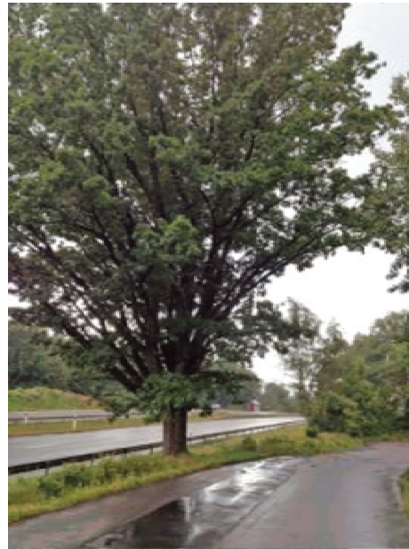
Figur 27. Grov ek väster om Österlyckan.

Med inarbetade skyddsåtgärder minimeras påverkan på eken. Eken bedöms endast ha lite rötter under vägbanken varför påverkan på rötterna blir ringa. När asfalten närmast trädet tas bort ökar även infiltrationen av vatten till trädet något. Den planerade beskärningen av ekens krona kommer att öka ekens livskraft. Eken bedöms klara sig. Med inarbetade skyddsåtgärder bedöms små och negativa konsekvenser uppstå (ringa påverkan på nationellt/regionalt värde, liten påverkan på kommunalt värde) jämfört med både nuläget och nollalternativet.