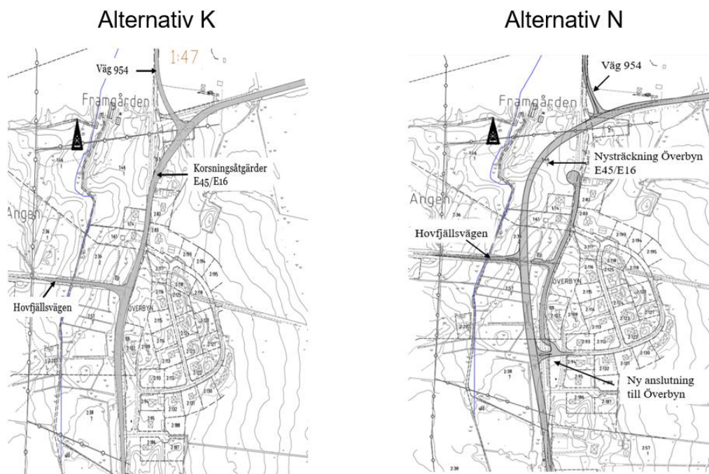
Figur 1. Karta över alternativen. Alternativen benämns alternativ K för korsningsåtgärder och alternativ N för väg i nysträckning förbi Överbyn.

Vid upprättande av vägplanens samrådsunderlag framkom det under arbetets gång att korsningsåtgärderna skulle medföra intrång på omgivande fastigheter och sannolikt resultera i betydande negativa konsekvenser för boende och trafiken på E45/E16 under byggtiden. I detta skede identifierades även ett möjligt alternativ för E45/E16, i nysträckning väster om Överbyn. En inledande studie av de två alternativen visade att det fanns anledning att fördjupa utredningen. Därmed fortsatte arbetet i samrådsunderlaget med de båda möjliga alternativen som visas i Figur 1.