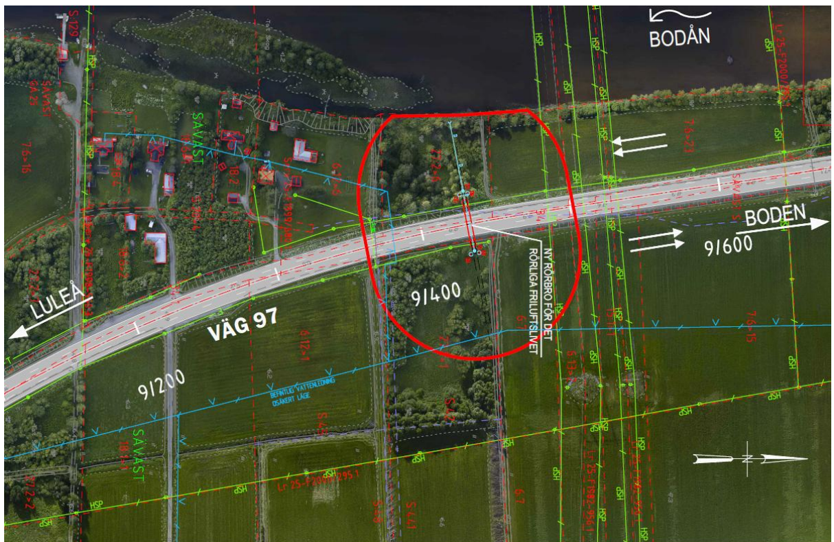
Figur 2. Påverkansområde för planerad grundvattensänkning vid ny rörbro, röddragen linje. Blåa streck är vattenledningar tillhörande Sävasnäs vattenledningsförening. Gröna streck utgör el- och tele i luft, luftledningsstolparna längs väg 97 kommer att avlägsnas och påverkas alltså inte av grundvattensänkningen.

Grundvattennivåerna kommer enligt utförda beräkningar att påverkas inom ett avstånd av ca 70 m från rörbron. Området redovisas i Figur 2. Beräkningarna baseras på högsta uppmätta grundvattennivå och har begränsats där den teoretiska avsänkningen är mindre än 0,3 m. Beräkningarna inkluderar en säkerhetsfaktor om 1,7, vilket innebär att påverkansområdet sannolikt har överskattats.