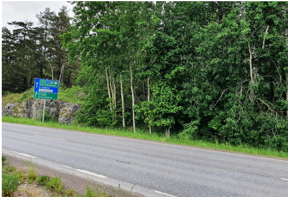
Figur 1: Lennings väg innan påfarten till E4.

Nyköping växer ständigt och nya bostadsområden planeras i anslutning till Östra infarten samtidigt som en fortsatt utveckling av handeln väntas. Detta innebär att trafiksituationen kommer att bli ännu mer ansträngd i framtiden. I centrala Nyköping planeras även för ett framtida resecentrum som under byggtiden kan komma att påverka trafikflödet vid Östra infarten ytterligare.