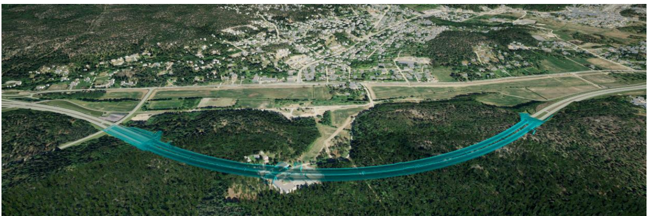
Figur 1. Modell över Glömstatunneln. Perspektivet är snett uppifrån mot nordost. Glömstavägen sträcker sig mellan bildens kortsidor. Illustration: Tyréns AB.

När tunneln är färdigbyggd kommer det kvarvarande inläckaget av grundvatten att samlas upp i ett ledningssystem som är skilt från vägdayvattnet. På sikt kan detta grundvatten ledas ut i Glömstadiket, då grundvattnet i sig är rent.