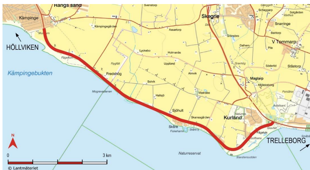
Figur 1 - Aktuell sträcka markerad med rött

Sträckan Höllviken – Stavstensudde är en del av Sydkustleden, ett cykelstråk som går längs Skånes sydkust och som på sikt ska binda samman Kattegattleden med Sydostleden. Berörda kommuner, Vellinge och Trelleborg, har pekat ut sträckan som ett viktigt stråk för rekreation och cykelturism, men även för pendling. Det finns ingen cykelväg på sträckan idag och då det saknas alternativa kustnära cykelstråk hänvisas cyklister till att cykla i blandtrafik längs vägen. En ny gång- och cykelväg planeras därför mellan Höllviken och Stavstensudde utmed väg 511 i Skåne län. Sträckningen kommer att grundas på en avvägning mellan olika intressen där särskild hänsyn kommer att tas till områdets natur- och kulturmiljövärden. Eventuella passager kommer att placeras så att god trafiksäkerhet uppnås.