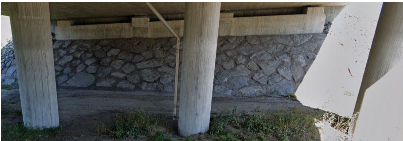
Figur 1 Princip Glacis