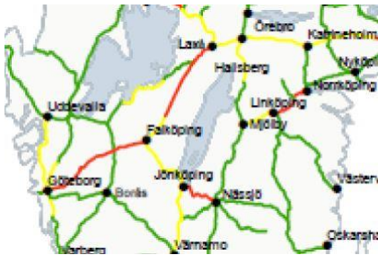
Bild 2: Kapacitetsutnyttjande dygn 2019. Rött = högt kapacitetsutnyttjande, Gul = medelhögt kapacitetsutnyttjande, Grön = lågt kapacitetsutnyttjande.

Sträckan Göteborg-Floda är en mycket tätt trafikerad sträcka där godståg samsas med resandetåg av olika slag. Kapacitetsutnyttjandet är högt både på grund av mycket trafik och att tågen kör i olika hastigheter på sträckan. På den tätast trafikerade sträckan, mellan Göteborg och Lerum, är trafikmängden en vardag cirka 4 fjärrtåg, 40 godståg, 90 pendeltåg, 50 regiontåg och 50 snabbtåg.