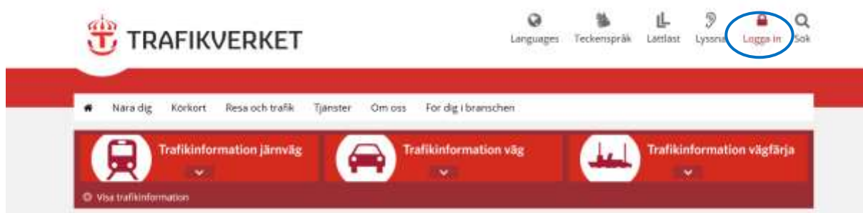
Bild 1, inloggning från trafikverket.se.