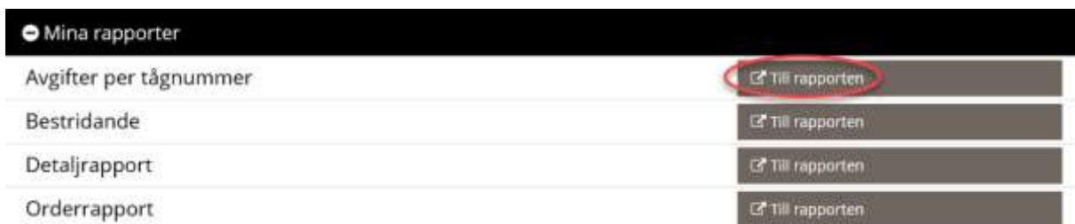
Bild 9, Rapportmeny.

Gå in på Mina Rapporter och välj rapporten, Avgifter per tågnummer