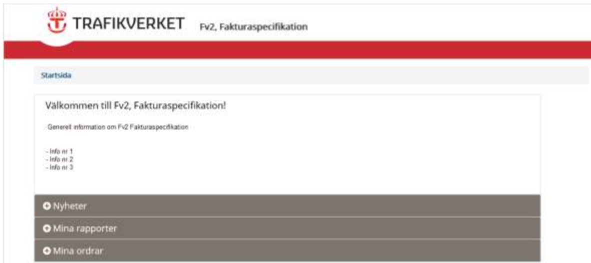
Bild 8, Min sida som visar fasta nyheter, Nyheter, Mina rapporter och Mina ordrar.

Gå in på Mina Rapporter och välj rapporten, Avgifter per tågnummer