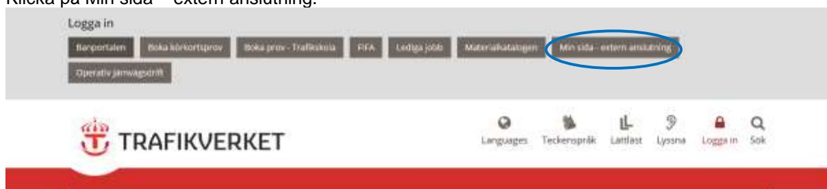
Bild 2, val för inloggning.