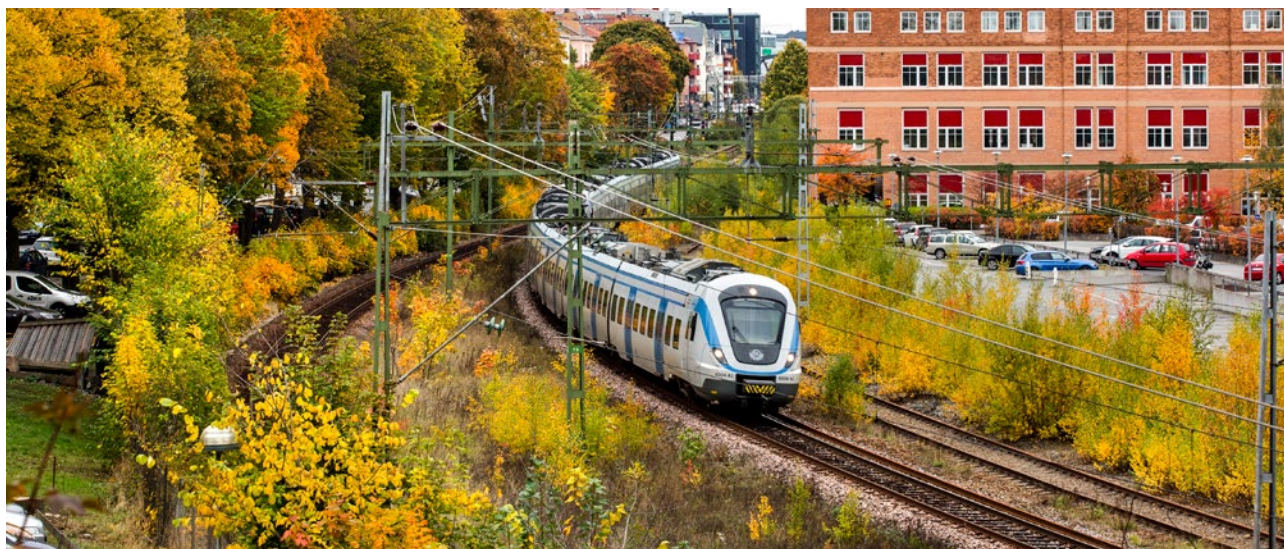
Sundbyberg hösten 2016.