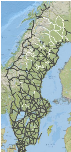
Efter stöd sommar 2024 (omg 7)