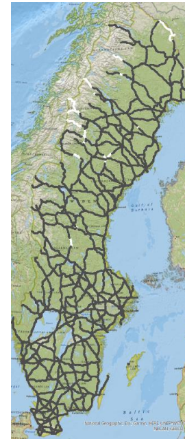
Efter stöd VT 2023 (omg 5)