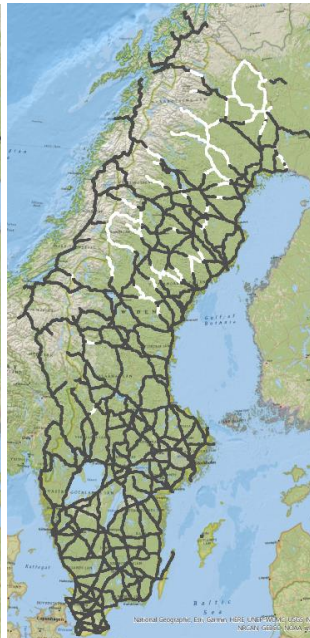
Efter stöd HT 2020 (omg 1)