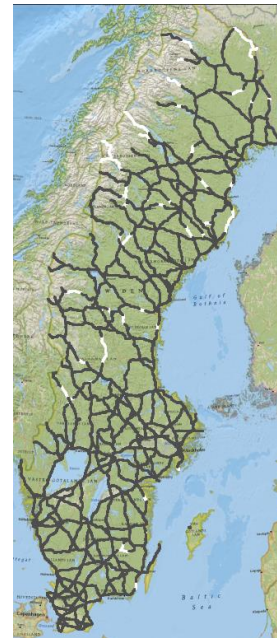
Efter stöd HT 2022 (omg 4)