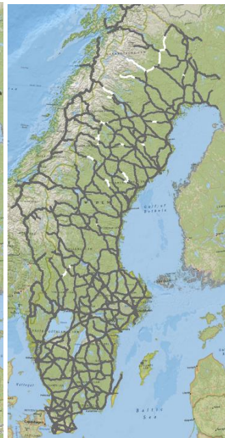
Efter stöd VT 2021 (omg 2)