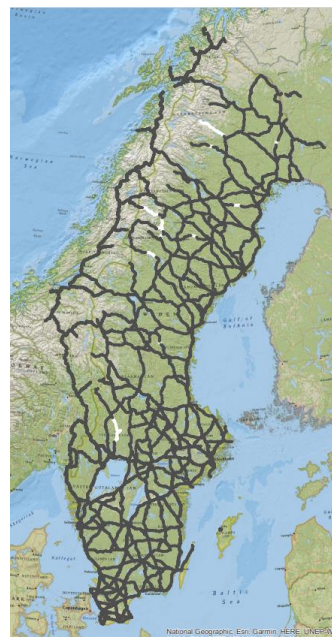
Efter stöd HT 2021 (omg 3)