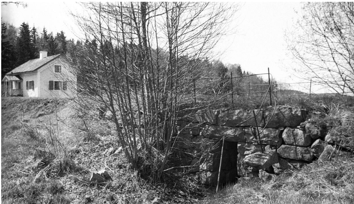
Figur 14 Lindöbro år 1946

Lindöbro ligger som namnet antyder vid bron över den före detta sundet till Lindö. Torpet ligger längs den tidigare landsvägen. Idag har sundet grundats upp och det finns nästan inget vatten kvar under bron. Vid den gamla stenbron står en milsten från mitten av 1800-talet.