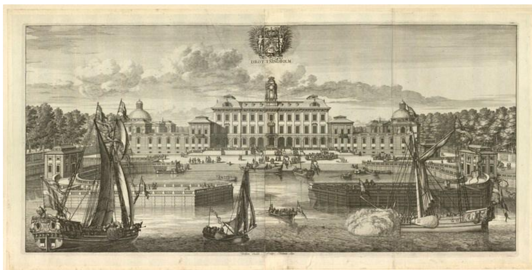
Figur 5 Drottningholms slott. Ur Erik Dahlberghs Suecia antiqua et hodierna, 1698-1701 (blad II:77).

Stenhuset brann ned år 1661, men de tjocka murarna finns bevarade i dagens slottsbyggnad. Änkedrottning Hedvig Eleonora lät återuppföra slottet efter ritningar av Nicodemus Tessin d ä. Slottet stod färdigt år 1698. Slottskyrkan – ett svenskt Pantheon - fullbordades under Ulrika Eleonoras tid år 1728. Hedvig Eleonora inspirerades av Palais de Luxembourg i Paris uppfört 1614-25 som ägdes av änkedrottning Maria de Medici. Bygget av Drottningholm kom att anpassas efter det som var kvar av stenhuset. Som arbetskraft tog man hjälp av ett stort antal soldater. Tegel togs från olika tegelugnar i Mälardalen, bland annat från Mälsåker, men slutligen uteslutande från det mer närbelägna tegelbruket vid Väntholmen.