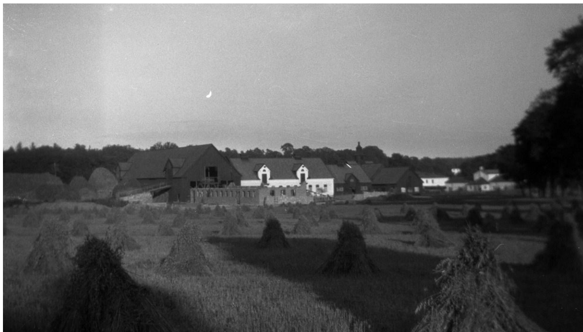
Figur 10 Kungsladugården år 1925