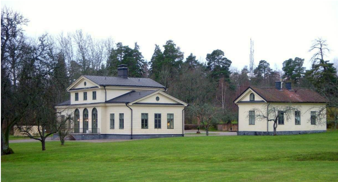
Figur 12 Vilan uppförd år 1792

Vilan med dess två flygelbyggnader uppfördes år 1792 efter ritningar av L. J. Desprez. Det var en livstidsförläning åt Gustaf III:s balettmästare, Louis Gallodier. Efter att Ekerövägen drogs om söderut över åkermarken, så ligger Vilan mer avsides än tidigare. Byggnaden har senare nyttjats som plåtslageri, café och tvättinrättning innan det år 1906 togs över och reparerades av Axel Wallenberg med familj. Till byggnaden hör en trädgård med växthus och lusthus.