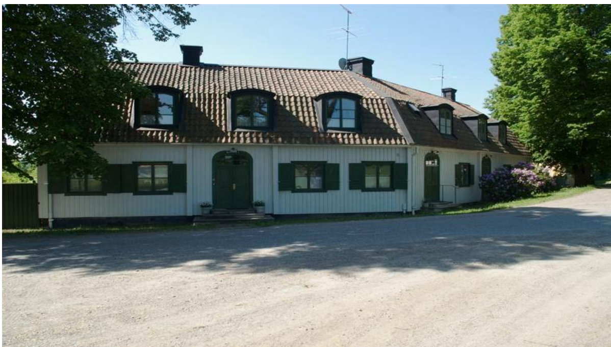
Figur 13 Kantongatan