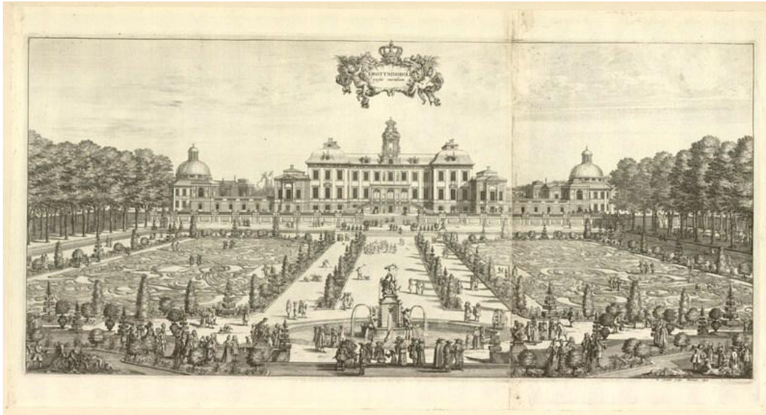
Figur 6 Drottningholms slottsträdgård. Ur Erik Dahlberghs Suecia antiqua et hodierna, 1698-1701 (blad II:78).

De nuvarande parkanläggningarna föregicks av en krydd-, köks- och fruktträdgård mellan stenhuset och Malmen. Väster om stenhuset låg en djurgård. Den första ansatsen till park var i form av en lustträdgård som ritades av Magnus Gabriel De la Gardie på 1650-talet. Nicodemus Tessin d.y. som tog över efter sin far år 1681, gjorde på uppdrag av änkedrottning Hedvig Eleonora en generalplan för parkanläggningarna med franska förebilder. Optik och geometri var vägledande och en karaktäristisk del var symmetrin och den tydliga mittaxeln. Hans främsta inspiratör och läromästare var André Le Nôtre.