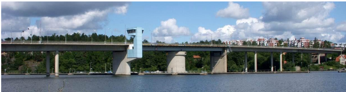
Figur 3 Nockebybron år 2008