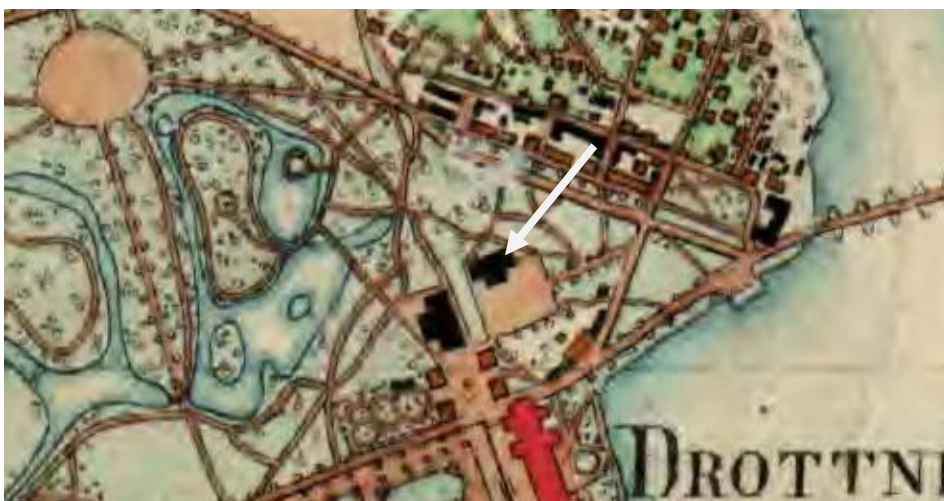
Figur 9 Utdrag ur konceptkartan till den häradsekonomiska kartan från 1880-tal (Aktbeteckning Brännkyrka J112-75-19). Notera det stigsystem och ridhuset (se vit pil) på platsen för den tidigare köksträdgården. Idag finns här två tennisbanor och parkeringsplats för bussar