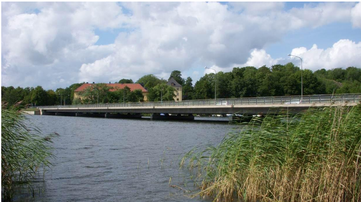
Figur 4 Drottningholmsbron år 2008