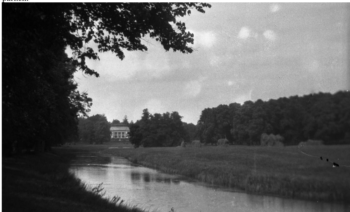
Figur 11 Utblick mot Hemmet från den engelska parken år 1922

På platsen för Hemmet låg tidigare en förvaltarbostad i direkt anslutning till Kungsladugården. Det var Gustav III som lät uppföra byggnaden under 1780-talet. Sannolikt var det efter arkitekten C.C. Gjørwells ritningar. Byggnaden uppfördes som tjänstebostad åt Ståthållaren på slottet. Placeringen är väl genomtänkt som ett inslag och blickfång i den engelskt inspirerade delen av Drottningholms-parken.