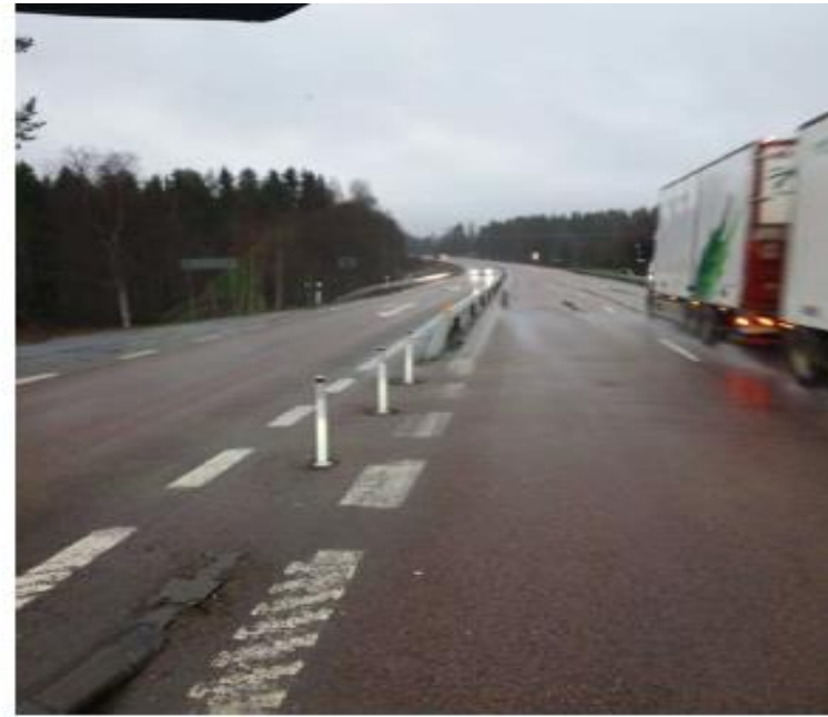
Markeringsstolpar uppsatta December 2020, numera bortrivna