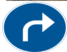
D1-5. Påbjuden körriktning, högersväng