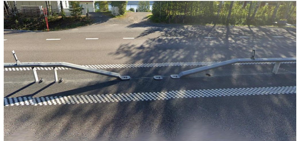
Mitträckets planerade utformning efter åtgärd