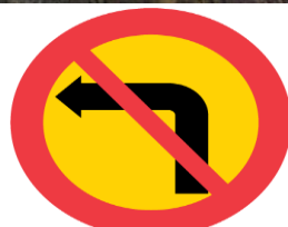
C25a. Förbud mot sväng i korsning, vänster