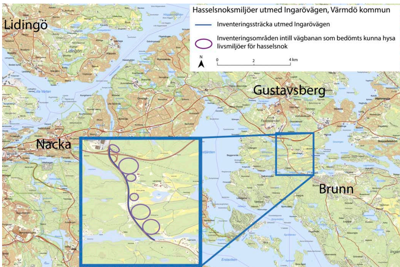
Figur 1. Översiktsskarta med avgränsat inventeringsområde.

Ömsskinn från fyra ormar har hittats vid en vägbank med sprängsten utmed den aktuella vägsträckan (blå linje, figur 2), dessutom har en observation av en orm gjorts på platsen. Vare sig ömsskinn eller observerad orm är artbestämda, det har dock uteslutits att ömsskinnen är från hasselsnok. Även flera groddjur har observerats på platsen vilket tyder på att vägbanken används som övervintringsplats för grod- och kräldjur. Utredningen ger därför även förslag till åtgärder som bedöms behöva utföras för att inte försämra den ekologiska funktionen som denna vägbank bedöms kunna ha för grod- och kräldjur i området. Utredningen har tagits fram som ett underlag inför anläggande av en ny gång- och cykelväg som Trafikverket planerar att genomföra Mellan Värmdö marknad och Brunn.