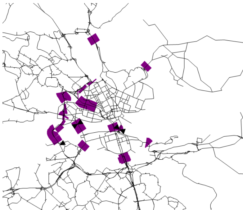
Figur 2: Utsnitt ur VisumDUE-vägnätet för Stockholm med trängselavgiftssnitten markerade i lila.

Figur 2 visar de centrala delarna av Stockholmsnätverket i VisumDUE med avgiftsbelagda länkar i lila. Lidingö-undantaget är inte implementerat i modellen. Avgiftsbelagda länkar tillhör ett av sex snitt: dagens tullring in/ut, Essingeleden N/S eller innerstadsbroarna N/S. Totalt ingår 41 länkar (riktningsberoende) i VisumDUE i dessa snitt. För att ändra trängselavgift på länkarna behöver både avgift i maxtimme och avgift i tre tidsperioder utanför maxtimme ändras. I vanliga fall ändras trängselavgift i VisumDUE (precis som i VISUM) via användargränssnittet genom att dubbelklicka på länken och ändra dessa fyra värden per länk. För varje trängselavgiftscenario innebär detta därmed att ändra 164 värden. Då en mängd scenarier körs i projektet märkte vi snart att denna process behövde automatiseras. Ett program har därför skrivits i språket R där endast trängselavgiftens nivå på de olika snitten behöver anges (sex värden). Programmet genererar sedan de data som behövs till en .NET-fil som kan läsas in tillsammans med VisumDUE-nätverket och automatiskt skriva över avgiftsnivån (både maxtimme och övriga tidsperioder) på de aktuella länkarna.