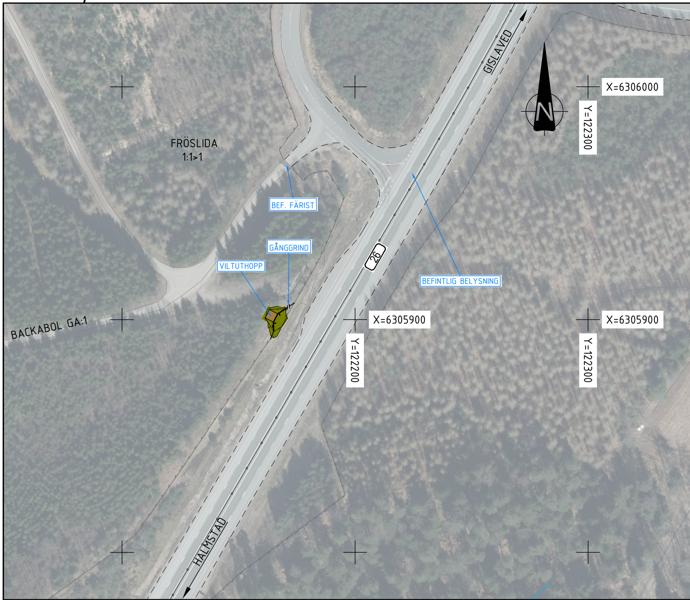
4:1 FRÖSLIDA S