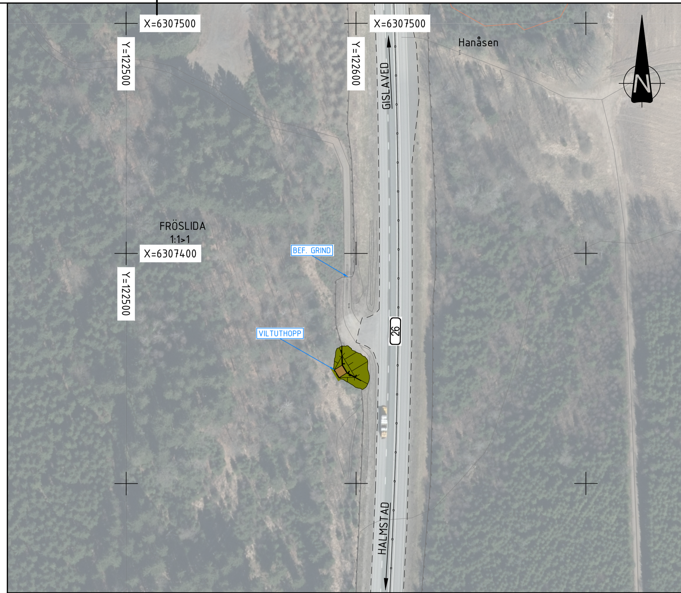
4:2 FRÖSLIDA N