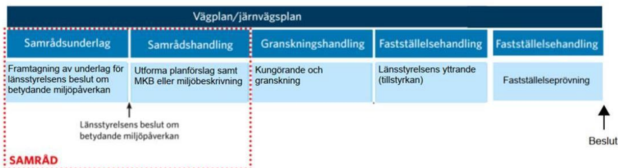
Figur 1. Planläggningsprocessen.

Byggstart kan ske tidigast då vägplanen vunnit laga kraft.