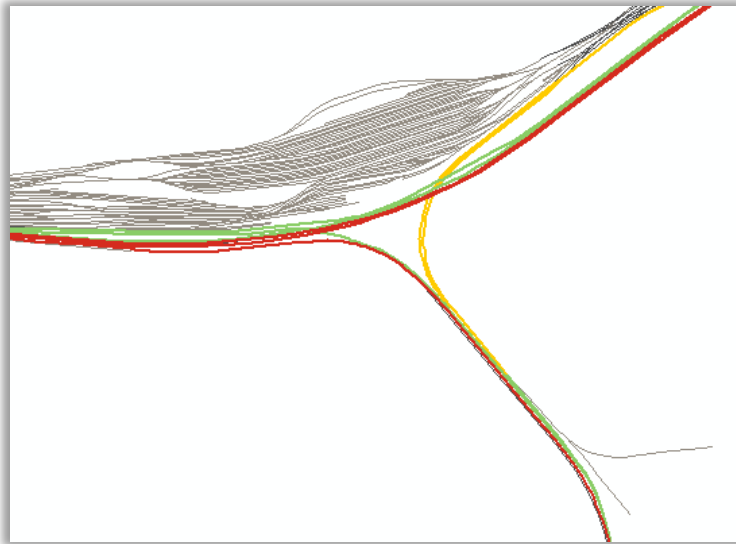
Figur 2 Exempel på symbolik baserad på 2 attributkolumner och samtidigt urval. Symbolik: Spår Huvud/Sido/IndKod och Spår Upp/Ned/Enkel/IndKod. Urval: Elektrifierade spår.