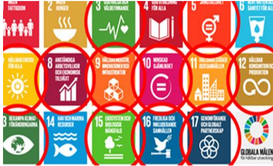
Flera mål samtidigt