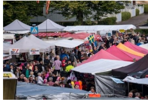
Offentliga affärer driver utveckling