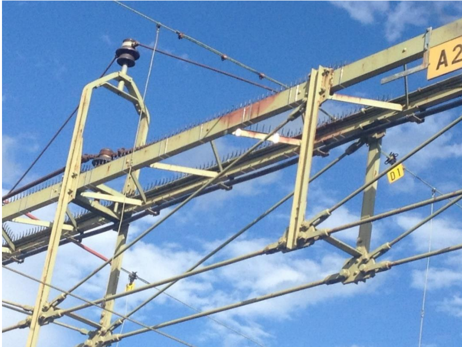
Bild 1 Kontaktledningsbrygga av äldre typ med delvis monterade fågelavvisare

Förseningsreduktion är aggregerad för hela statens järnvägsnät. Det beror i huvudsak på att det inte finns tillförlitliga underlag att dels kalkylera skadepotentialen hos skilda lokala fågelbestånd, dels kartlägga hittills utförda åtgärder.