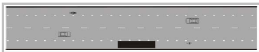
Figur 10-6. Vägrenshållplats.

Vägrenshållplats är en busshållplatstyp där angöringsutrymme för bussen är markerat på en minst 2 meter bred vägren. Hållplatstypen är vanlig längs befintliga s.k. 13-metersvägar på landsbygd. Plattform saknas ofta på vägrenshållplatser.