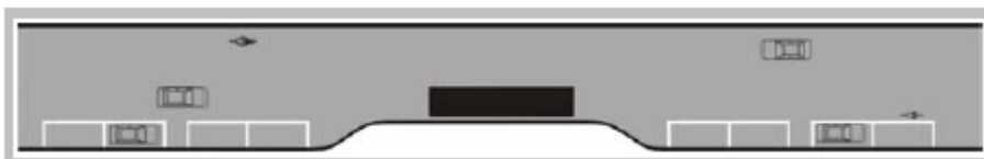
Figur 10-3. Klackhållplats.

Klackhållplats är en variant av körbanehållplats på gata med uppställningsfält. Plattform för av- och påstigande ordnas genom breddning av gångbanan så att den bryter uppställningsfältet längs gatan. Hållplatstypen kan användas i tätorter och är utformad så att bakomvarande fordon måste stanna om det endast finns ett körfält i varje riktning. På breda gator finns det möjlighet att köra om en buss som stannat vid en hållplats.