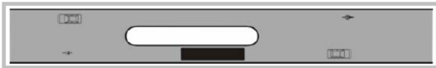
Figur 10-2. Enkel stopphållplats.

Enkel stopphållplats är en busshållplatstyp där körbanan delats med exempelvis refug så att endast ett körfält finns tillgängligt i bussens körriktning vid hållplatsen. Detta innebär att fordon som färdas i samma riktning som bussen inte kan passera då bussen stannar vid en hållplats. Hållplatstypen används i tätort.