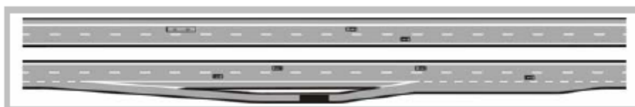
Figur 10-8. Avskild hållplats.

Avskild hållplats är en busshållplats som är avskild från genomgående väg-bana med en skiljeremsa eller refug, med eller utan räcke. Inbromsning sker i huvudsak på infarten och acceleration i huvudsak på utfarten vilket innebär minimal påverkan på övrig trafik.