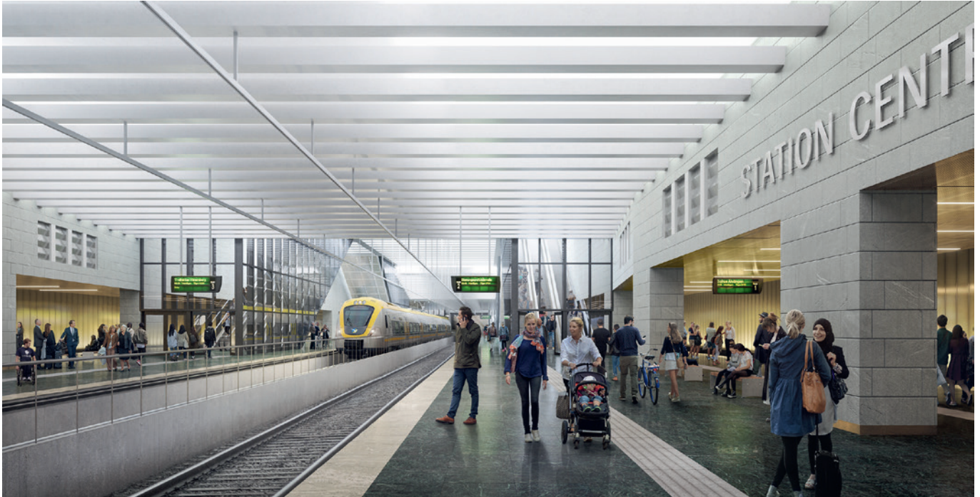
Visionbild. ILLUSTRATION: METRO ARKITEKTER

Projektaktuell - Centralen, november 2018