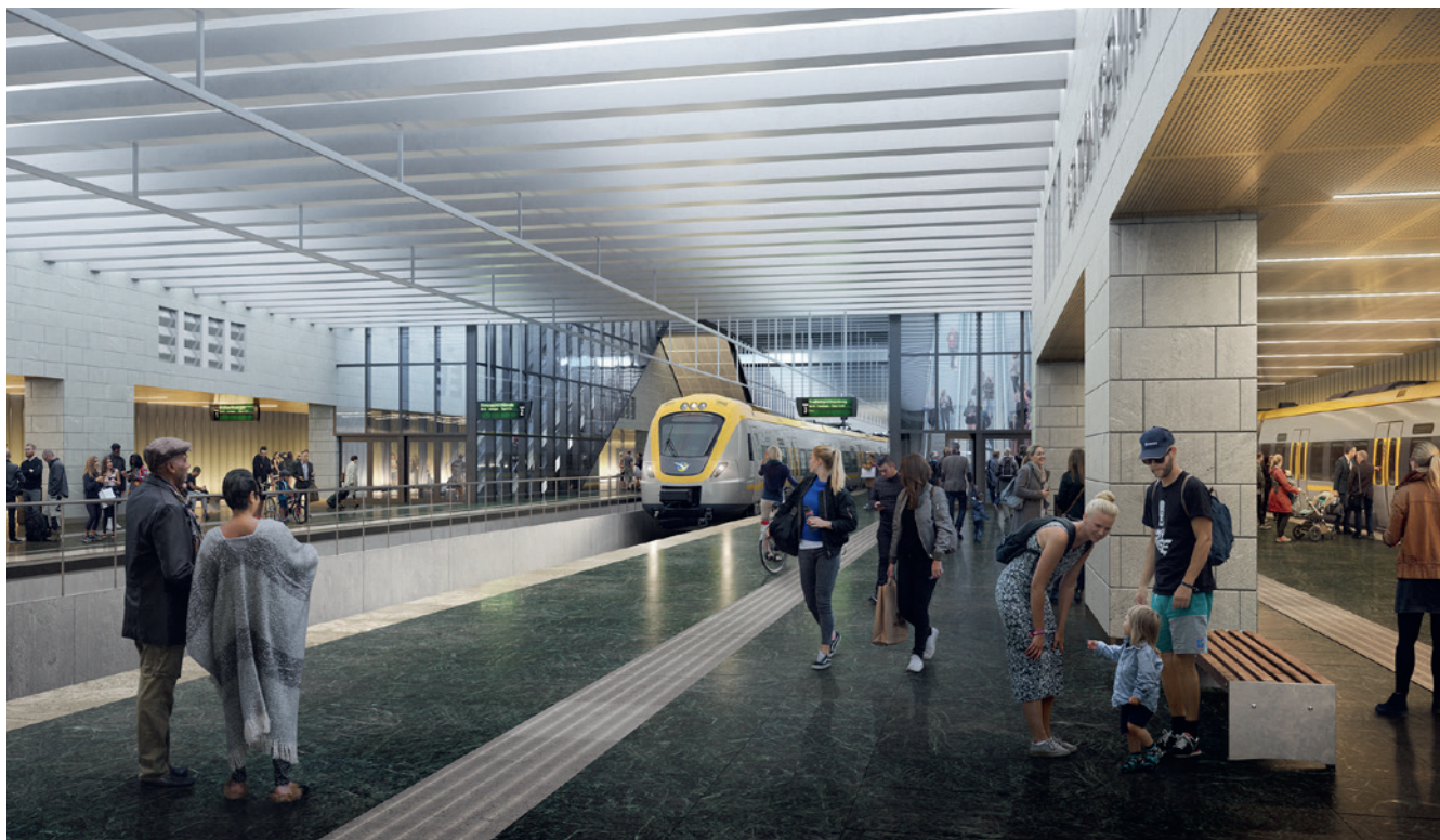
Visionsbild av station Centralen. ILLUSTRATION: METRO ARKITEKTER