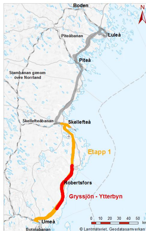
Figur 1. Norrbotniabanan med Etapp 1, Umeå Skellefteå och sträckan genom Robertsfors kommun.

En ny järnväg mellan Umeå och Luleå ger möjlighet till både tyngre och längre tåg. Med Norrbotniabanan beräknas företagens transportkostnader minska med upp till 30 procent. En sådan effektivisering får inte bara genomslag i norr utan i hela landet eftersom mer än hälften av den tunga godstrafiken kommer från norr med destination i söder. Norrbotniabanan innebär att den regionala persontrafiken mellan Umeå, Skellefteå, Piteå och Luleå kan utvecklas. Restiderna på sträckan kan halveras med Norrbotniabanan, något som förstärker möjligheterna till arbetspendling.