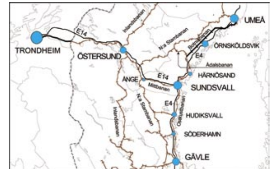
Järnvägar och större vägar i Mittnordenområdet.